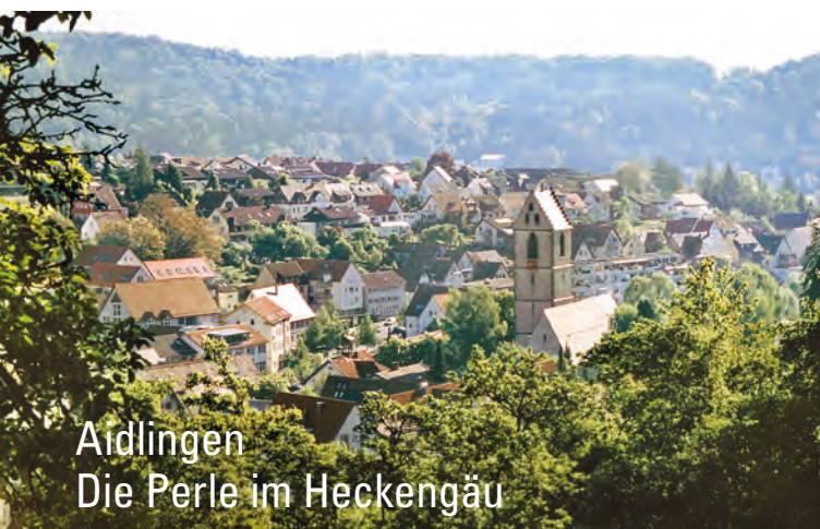
Aidlingen Die Perle im Heckengäu

Wacholderheiden, Hecken und Streuobstwiesen – hier finden sich viele ganz typische Naturelemente des Heckengäus und schaffen ein Landschaftsbild wie anno dazumal! Dazu trifft man oft auf wollige vierbeinige Landschaftspfleger, die helle Farbtupfer in die grüne Umgebung setzen – Eindrücke wie aus dem Bilderbuch.